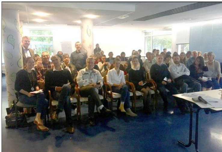
Le personnel médical présent à la réunion

Vendredi, la maison de retraite du Val d'Arve a accueilli une réunion d'information sur le cancer, et plus précisément le cancer du sein.