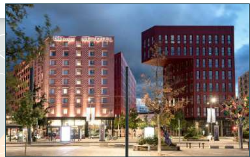
L'ilot Poste Weiss est située face à la gare SNCF, en bordure de l'esplanade de France, accueille entre autre le siège de la CPAM de la Loire, un Ibis Budget et un hôtel Novotel.