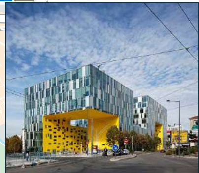
La Cité Grüner dédiée à l'activité tertiaire et située dans le quartier de Châteaureux, accueille notamment Saint-Etienne Métropole, la Direction Départementale des services fiscaux, EPORA (Etablissement Public Foncier Rhône-Alpes), la DDT (Direction Départementale des Territoires de la Loire), la SEDL (Société d'équipement du Département de la Loire) et la SNCF. Signé de l'architecte parisienne Manuelle Gautrand, cet immeuble de bureaux de 27000 m 2 sur huit niveaux accueille, entre autres utilisateurs, les agents de Saint-Etienne Métropole. Réalisé entre 2009 et 2010, il est long de 108 m et haut de 34 m, avec un spectaculaire porte-à-faux en angle de 25 m sur quatre niveaux.

Toutes les stations de tramway sont accessibles aux Personnes à Mobilité Réduite